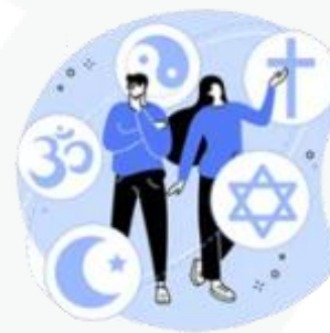
sua preferência religiosa

A partir disso, fica fácil compreender que o uso mal intencionado desses dados pode criar muitos problemas, como ocorre com os conhecidos golpes de boletos bancários, fraudes em contas de aplicativos, abertura indevida de contas bancárias e consumo indevido.