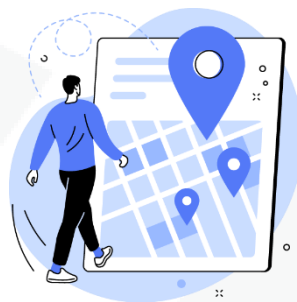
seus hábitos de deslocamento