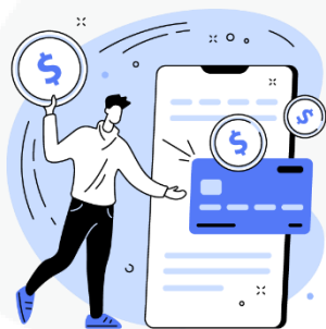
seus hábitos de consumo